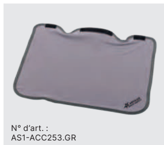
N° d'art. : AS1-ACC253.GR