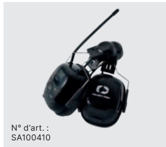
N° d'art. : SA100410