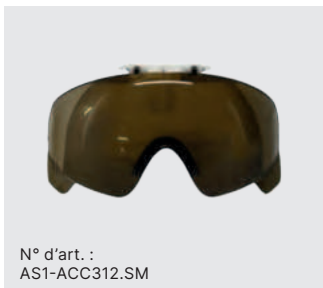
N° d'art. : AS1-ACC312.SM