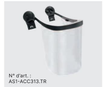
N° d'art. : AS1-ACC313.TR