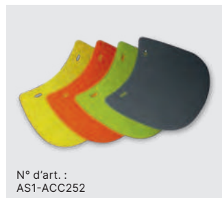
N° d'art. : AS1-ACC252