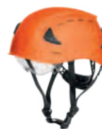
N° d'art. : AS1-700R41.OR-000