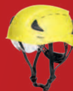
N° d'art. : AS1-700R41.YE-000