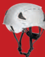
N° d'art. : AS1-700R41.WT-000