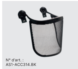
N° d'art. : AS1-ACC314.BK