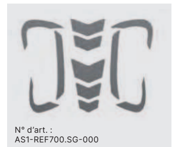
N° d'art. : AS1-REF700.SG-000