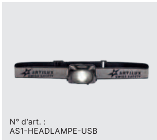
N° d'art. : AS1-HEADLAMPE-USB

Des accessoires avancés, entièrement intégrables, permettent d'adapter tous les casques à des besoins individuels.